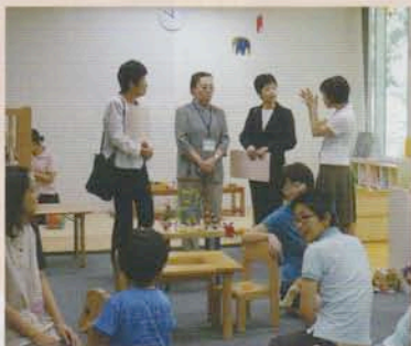
子育てカレッジの1コマ