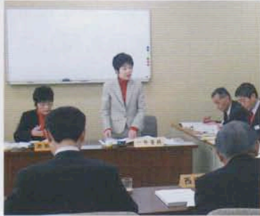
県幹部への質問の1コマ