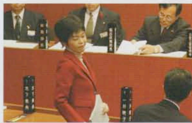
議長に名前を呼ばれる