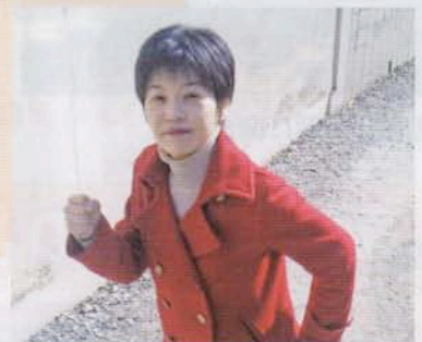
まちへ飛び出す1コマ

頭で考えるより先 に、自分の足で確 かめる。すぐに行 動に移すようにし ています。