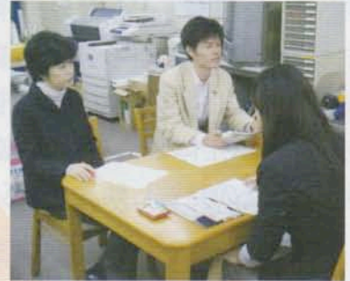
記者の方々との1コマ