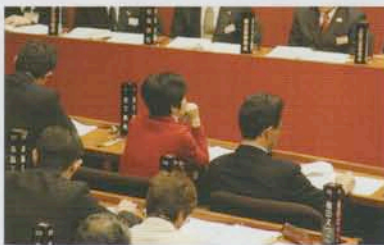
議席で内容に聞き入る