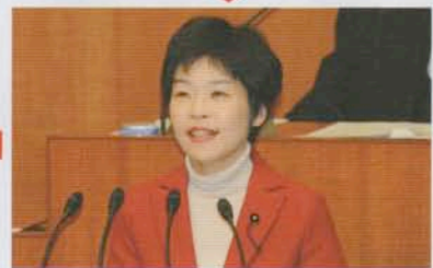
明るく質問を開始する