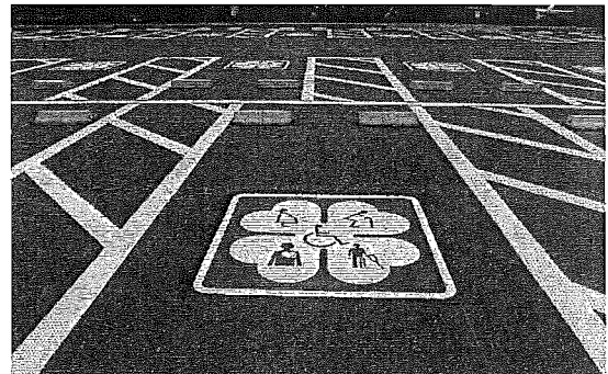
[障害者用駐車枠の状況]