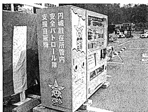
円城駐在所管内パトロール隊