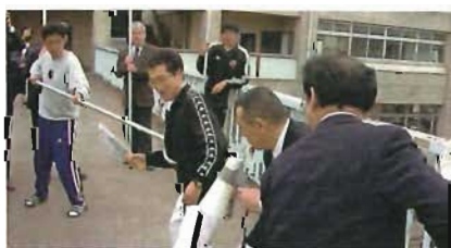
安全管理についての研修・訓練

また、保護者、地域住民、警察署など関係機関との情報の共有など体制整備が重要です。