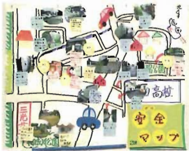
地域安全マップづくり

通学路などで犯罪の被害に遭わないため、防犯に関する理解を深めたり、危険予測能力や危険回避能力を身に付けたりすることができるように安全教育の充実に努めます。