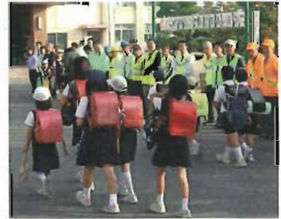
登下校時のあいさつ運動