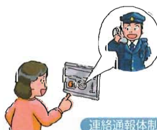
連絡通報体制の整備