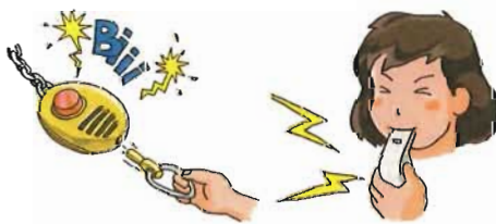
防犯ブザーなどの使用訓練