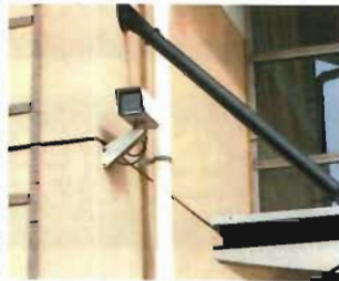
防犯カメラや受付場所へ誘導するための看板の設置