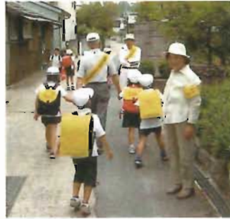
地域ぐるみによる見守り協力体制