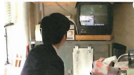
防犯機器等の整備・点検